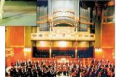
Концерт симфонической музыки