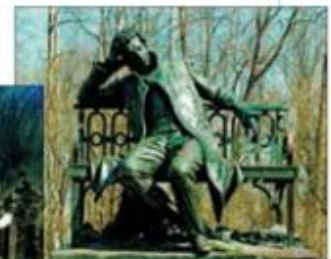
Памятник А.С. Пушкину