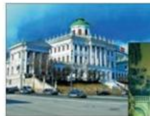
Дом Пашкова (г. Москва)